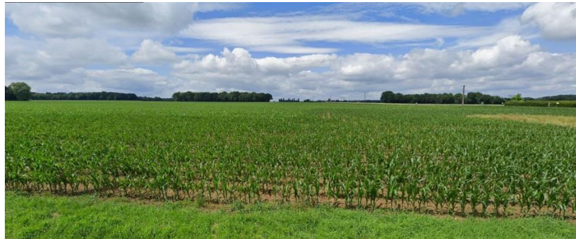
Champs céréaliers à Saint-Jean-de-Beauregard

Maintenir et développer les alignements d'arbres le long des voies , comme élément structurant du paysage urbain, et comme élément de biodiversité et continuités écologiques.